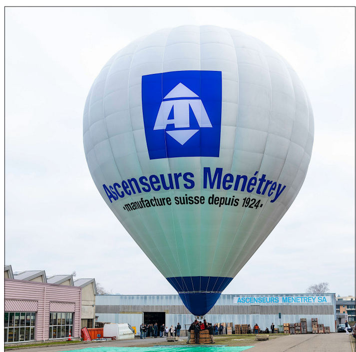
L'envol d'une nouvelle montgolfière a marqué jeudi le lancement de l'année du centenaire.

A l'automne, une collaboration avec la troupe romontoise du Théâtre des Remparts donnera lieu à la pièce Week-enden ascenseur , à Bïcubic. Aux représentations publiques s'ajouteront des soirées réservées aux partenaires et collaborateurs de l'entreprise. EB